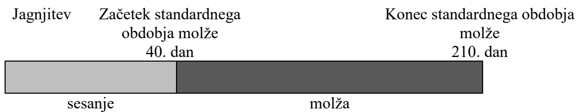
Slika 2: Količina namolzenega mleka v standardnem obdobju molže

Izračun količine namolzenega mleka pri oplemenjeni bovški ovci temelji na izmerjeni količini namolzenega mleka na kontrolni dan enkrat mesečno v celi laktaciji kot tudi v standardnem obdobju molže, ki traja od 40. do 210. dne laktacije (Slika 2).